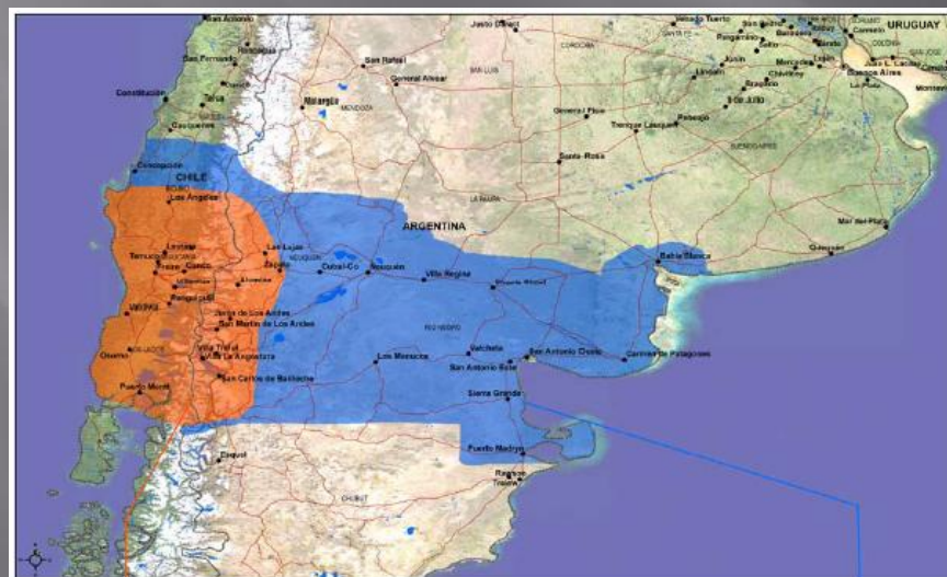
Grupo 2: Circuito Turístico Binacional de la Zona de Los Lagos

Argentina: área precordillerana y cordillerana de las Prov. de Neuquén y Río Negro.